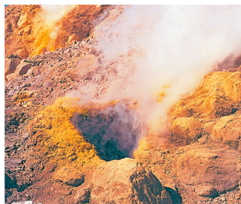
▲火山の噴気孔(宮崎県えびの高原) 噴気孔のまわりの黄色い結晶は硫黄。

自然の[災害]や[恩恵]のしくみを理解し、自然との[共生]を考える必要がありますね。