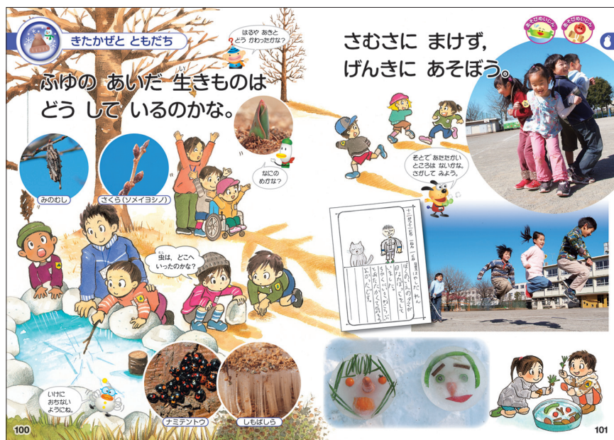
23年度版教科書 上巻100～101