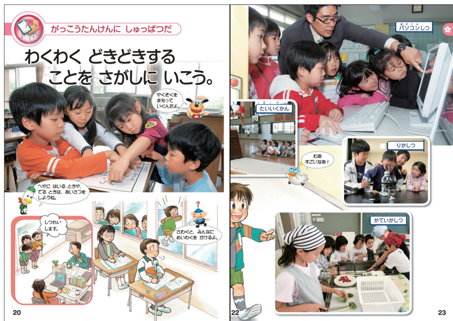
23年度版教科書 上巻P20, 23