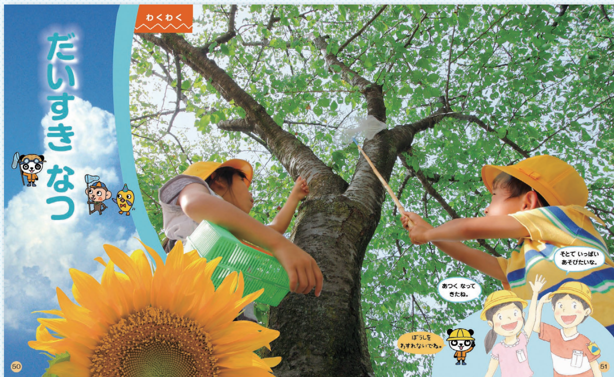
AB判を利用したダイナミックな単元扉は単元導入に有効です。

編集の基本方針から目指します、「活動の流れの明確化」、「特別支援教育への対応」、「活動が見て取れる紙面」を実現するためには、本編の情報量を精選・見やすくし、低学年の子どもたちに無理なく見て取れるようにする必要があります。旧版（H23～H26使用）で目指した「読んでわかる教科書」を見直し、「読んで、見て、わかる教科書」として内容を再構成しました。