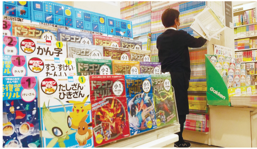
さまざまなドリルや参考書が並ぶ書店の売り場。ポケモンやドラゴンのドリル(手前)などが人気=1月、神奈川県横浜市の有隣堂たまプラーザテラス店