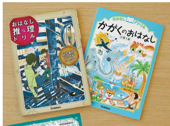
「おはなし推理ドリル 科学事件ファイル 小学4〜6年」と「おはなしドリル かがくのおはなし 小学1年」(ともにGakken)