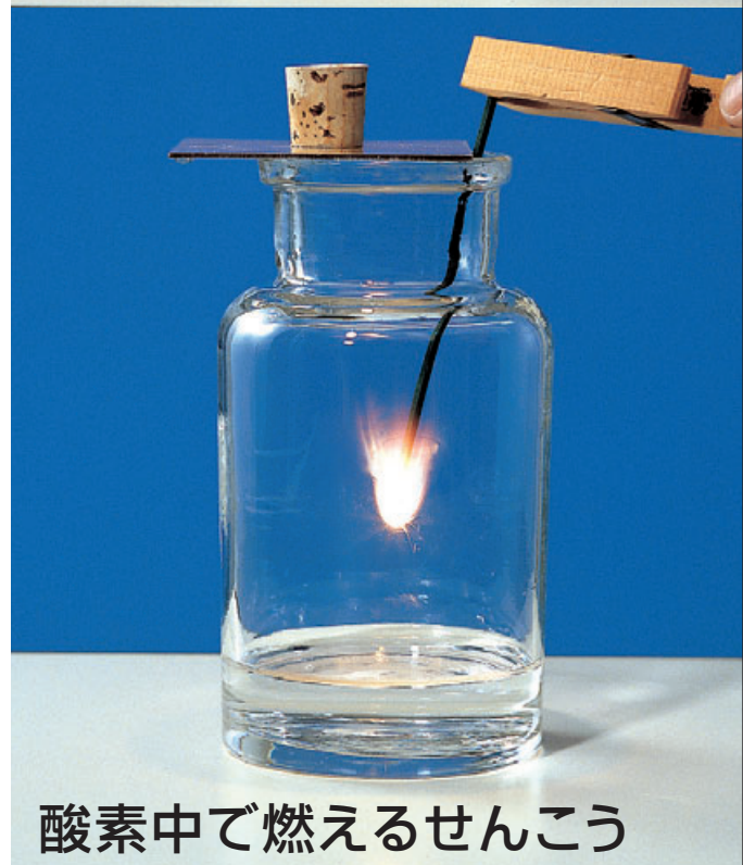
酸素中で燃えるせんこう