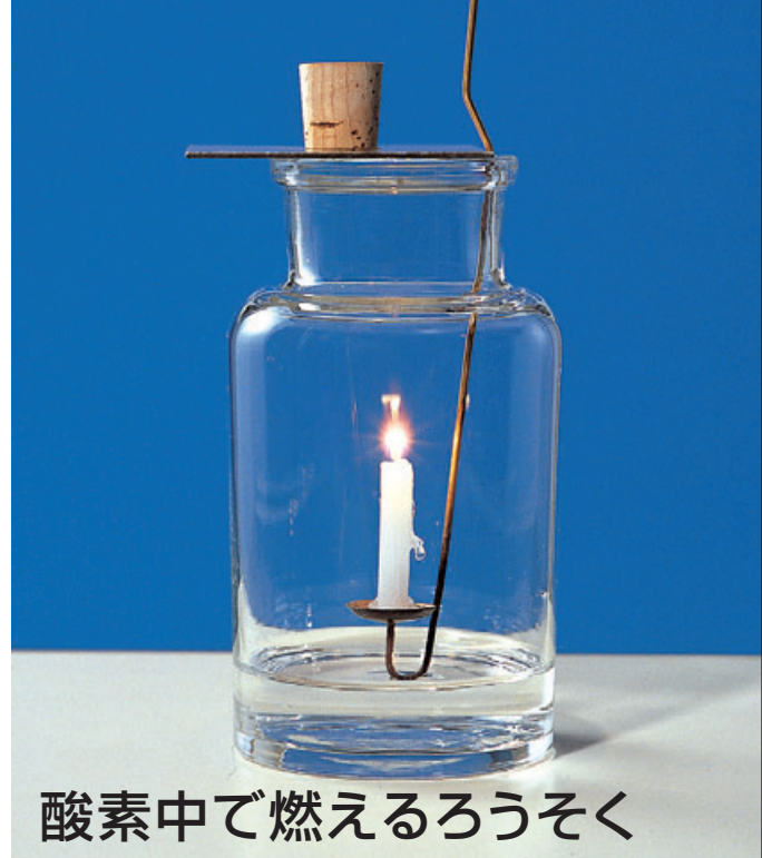
酸素中で燃えるろうそく

ちっ素や二酸化炭素には、ものを燃やすはたらきはない。空気中では、ものがおだやかに燃える。