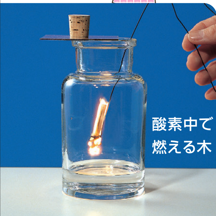
酸素中で燃える木