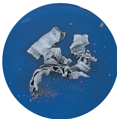
紙が燃えたあとの灰